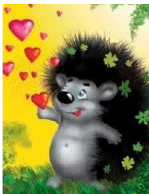
Робота учнів 1 класу

З того часу всі Їжачки мають голки, й коли їм загрожує небезпека, вони згортаються у клубок.